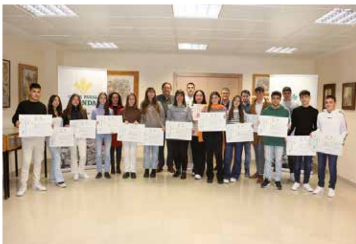
Premios a la Excelencia 2023