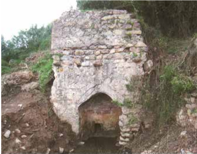
El Batanero del riu Sonella o Anna