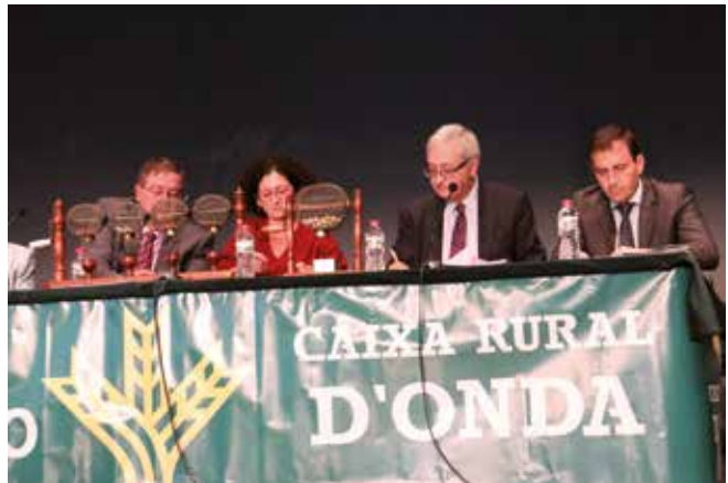
Sorteo Tradicional del Ahorro