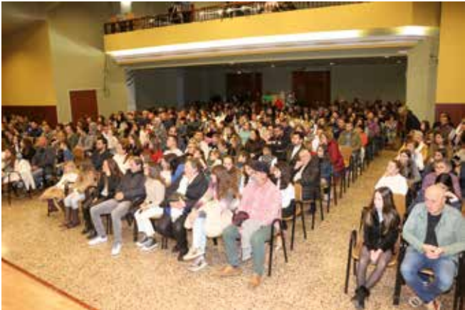
Público asistente a la entrega de premios a los ganadores del Certamen Literario Escolar y al Sorteo del Ahorro Infantil.