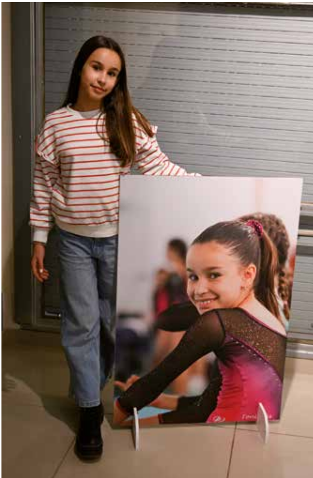
Exposición Fotográfica "Gymnasia", de Toni Diago.