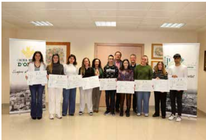
Becas a la Excelencia año 2023

Pueden consultarse las bases en www.caixaonda.com o en cualquier oficina de nuestra Caja Rural.