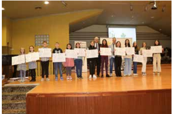
Ganadores del XXXVII Certamen Literario Escolar.