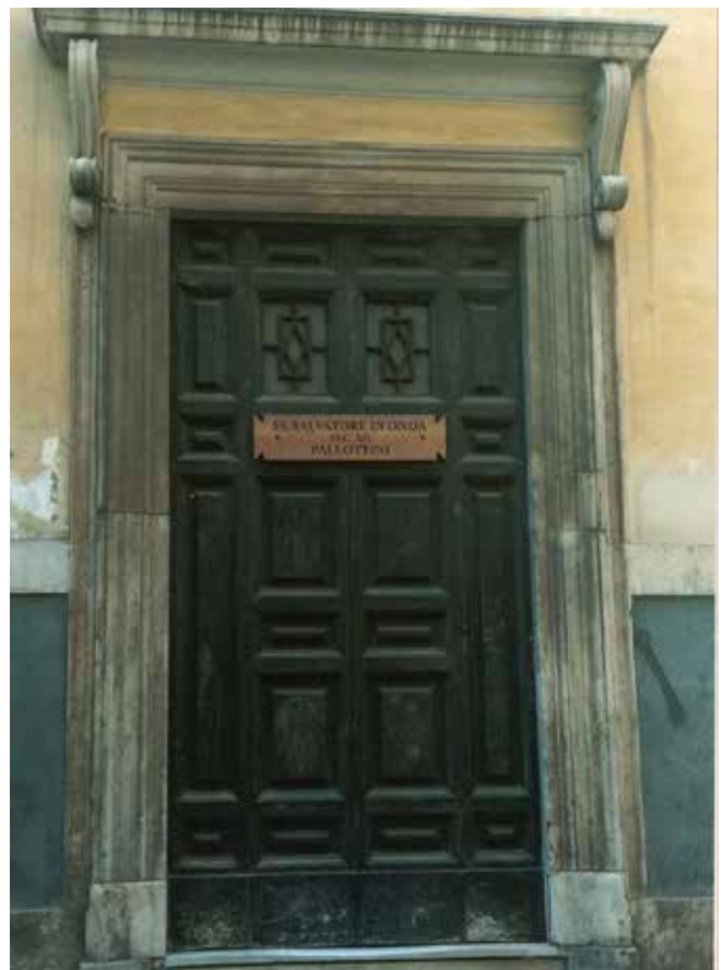
Iglesia de San Salvatore in Onda (Roma)