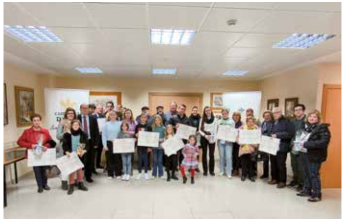
Participantes en el Concurso de Belenes de la Caja Rural.