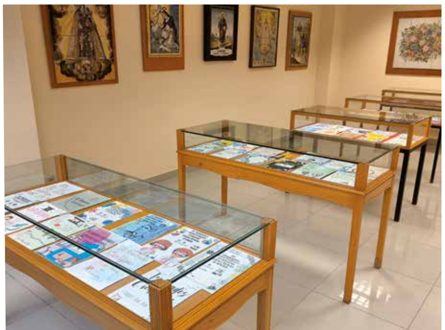
Exposición de los carteles participantes en el Concurso.

El acto concluyó con un espectáculo de magia patrocinado por el Ayuntamiento de la localidad.