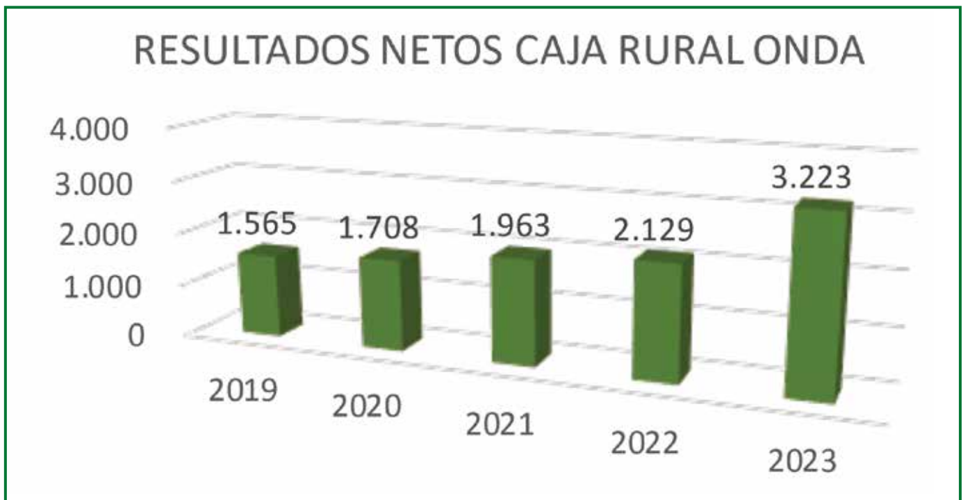
Datos en miles de euros

En definitiva, un buen ejercicio económico para las cajas rurales valencianas en general, y para Caja Rural Onda en particular, que nos posicionan en un lugar envidiable para afrontar los retos de futuro.