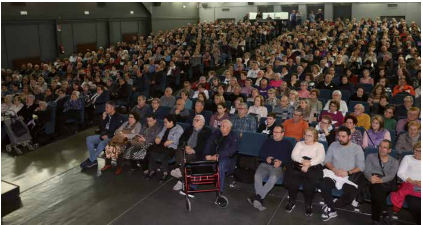
Asistentes al Sorteo del Ahorro celebrado en el Teatro Cine Mónaco.