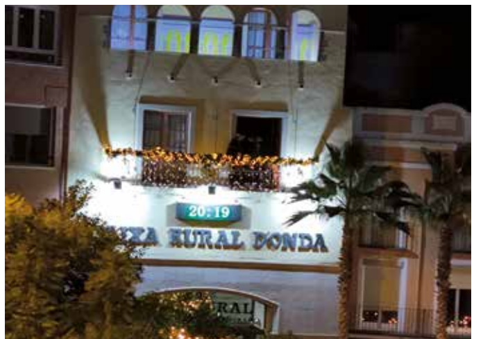
La Oficina Principal engalanada para las fiestas navideñas.