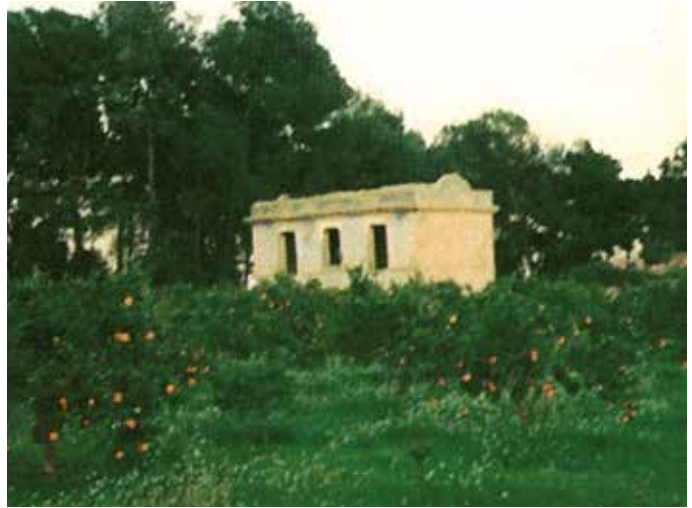
Casa de Los Caballos