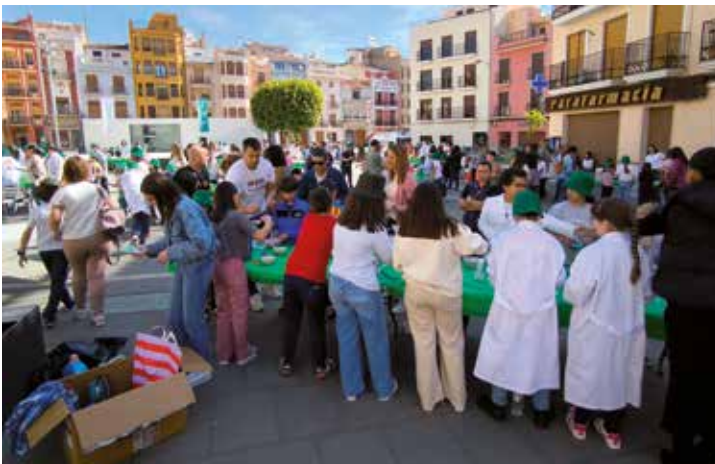
Uno de los talleres en pleno funcionamiento.