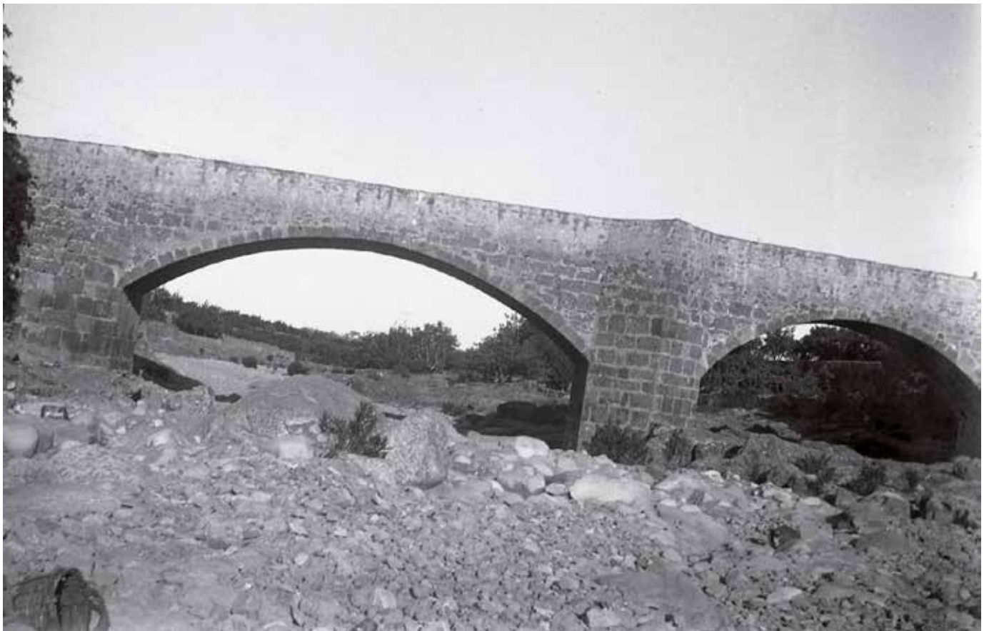
Puente medieval sobre el río Sonella a su paso por el término municipal de Onda (hacia 1930).

Ya hemos hecho referencia al régimen irregular de lluvias que caracteriza el clima mediterráneo. Las lluvias torrenciales del otoño suelen traducirse