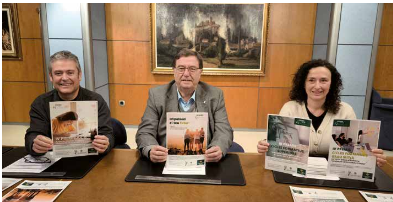
Acto de presentación convocatoria Becas y Premios 2024