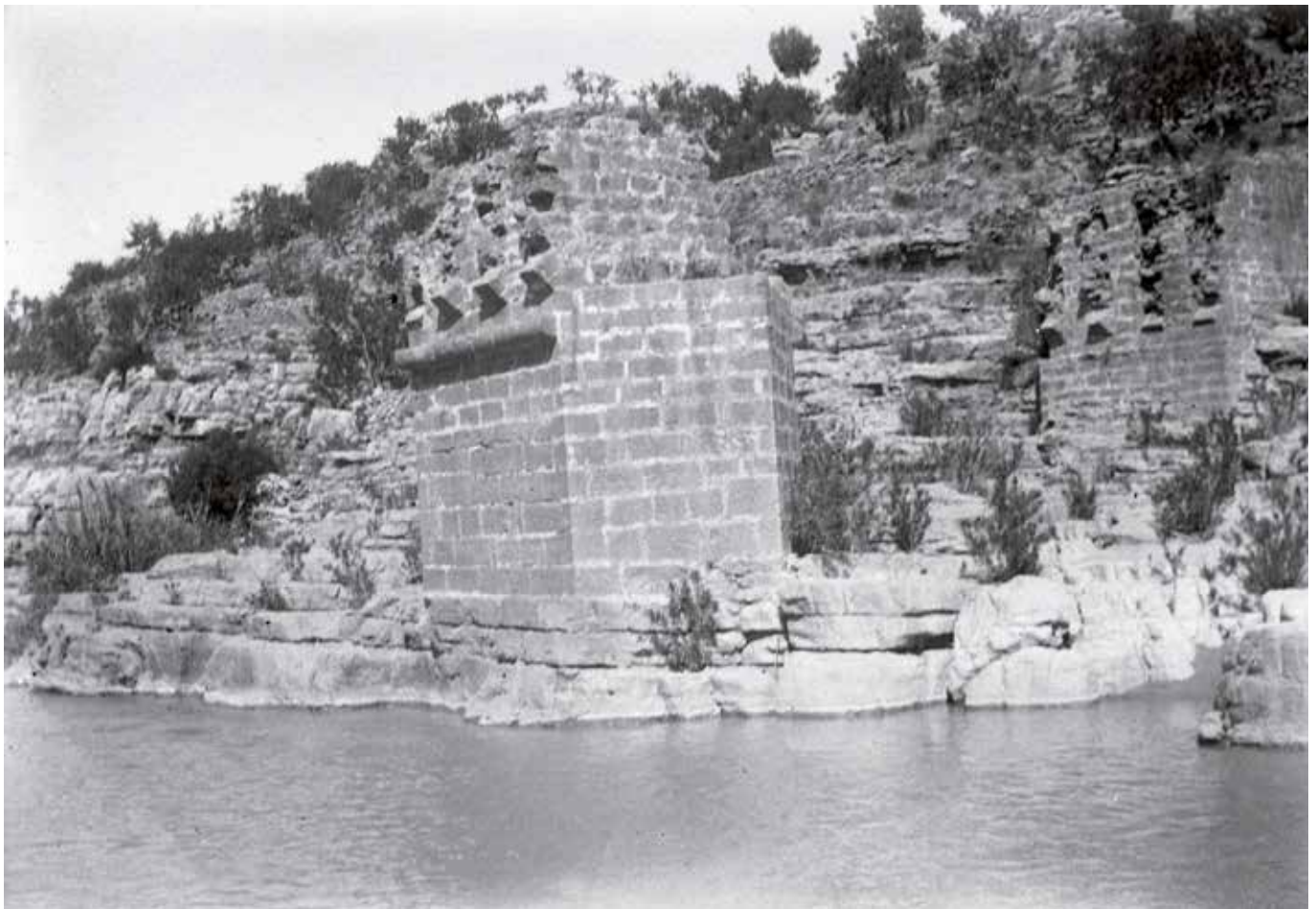
Pilares del puente romano sobre el río Mijares a su paso por el término municipal de Onda (hacia 1930).

Pero las comunicaciones no pueden interrumpirse a la espera de la llegada del buen tiempo. Fueron los romanos los primeros habitantes de nuestra zona geográfica en establecer una red de caminos que permitiera a tropas, ciudadanos y mercancías desplazarse a través de todo su imperio. Hábiles constructores, los romanos donde encontraron ríos construyeron puentes, que constituyen prueba evidente de la existencia de una calzada romana allá donde se encuentran.