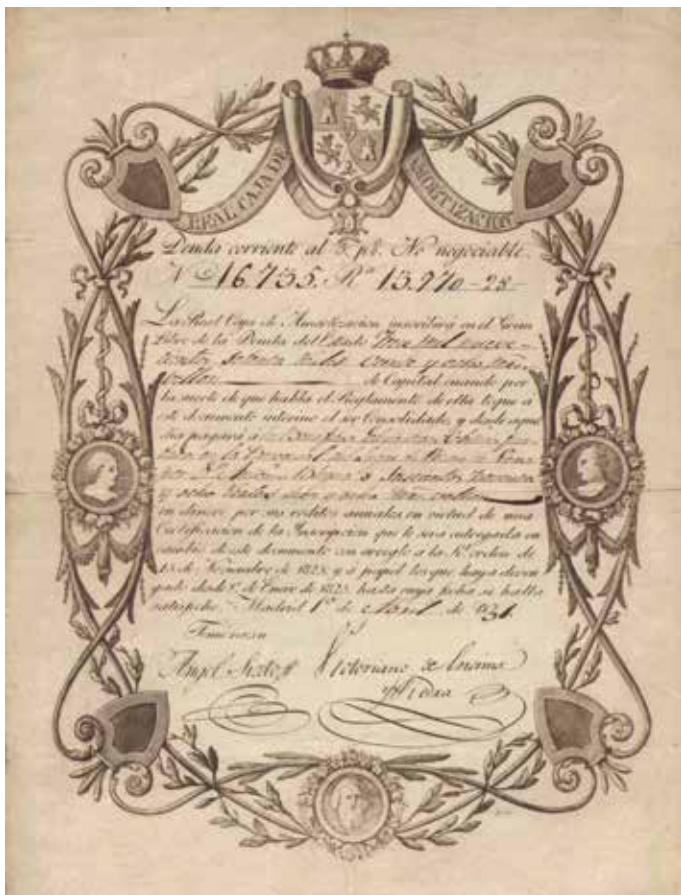
Real Caja de Amortización. Título de Deuda corriente al 5% No negociable. 1º de Abril de 1831.

respecto de los fondos con que contaba la corporación para cubrir la mitad del importe de las obras del puente que había de construirse sobre el río Mijares y si los tenía ya recaudados o cuando lo estarían.