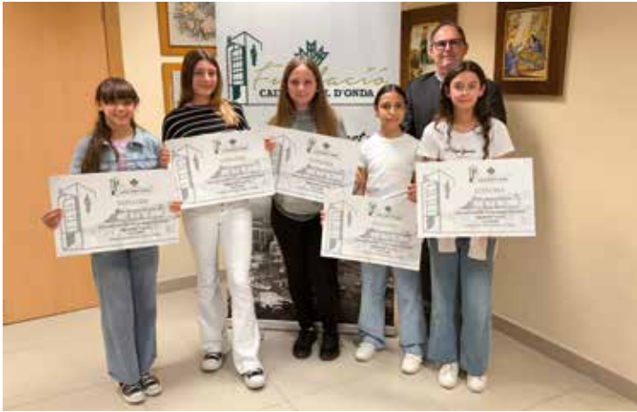
Premiados en el Concurso de Carteles.