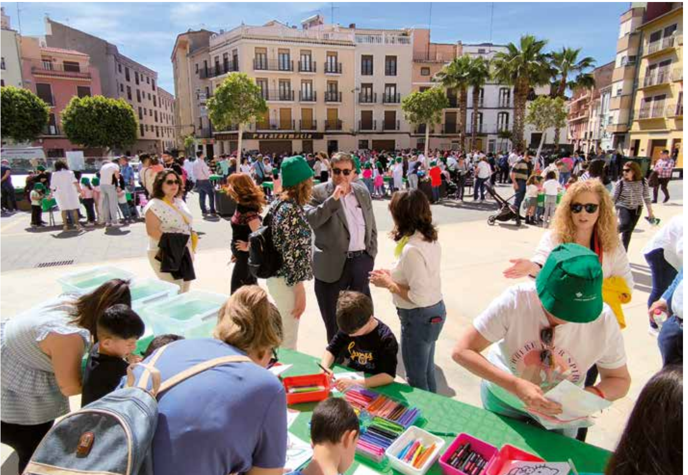
El día fue magnífico, y el ambiente festivo.