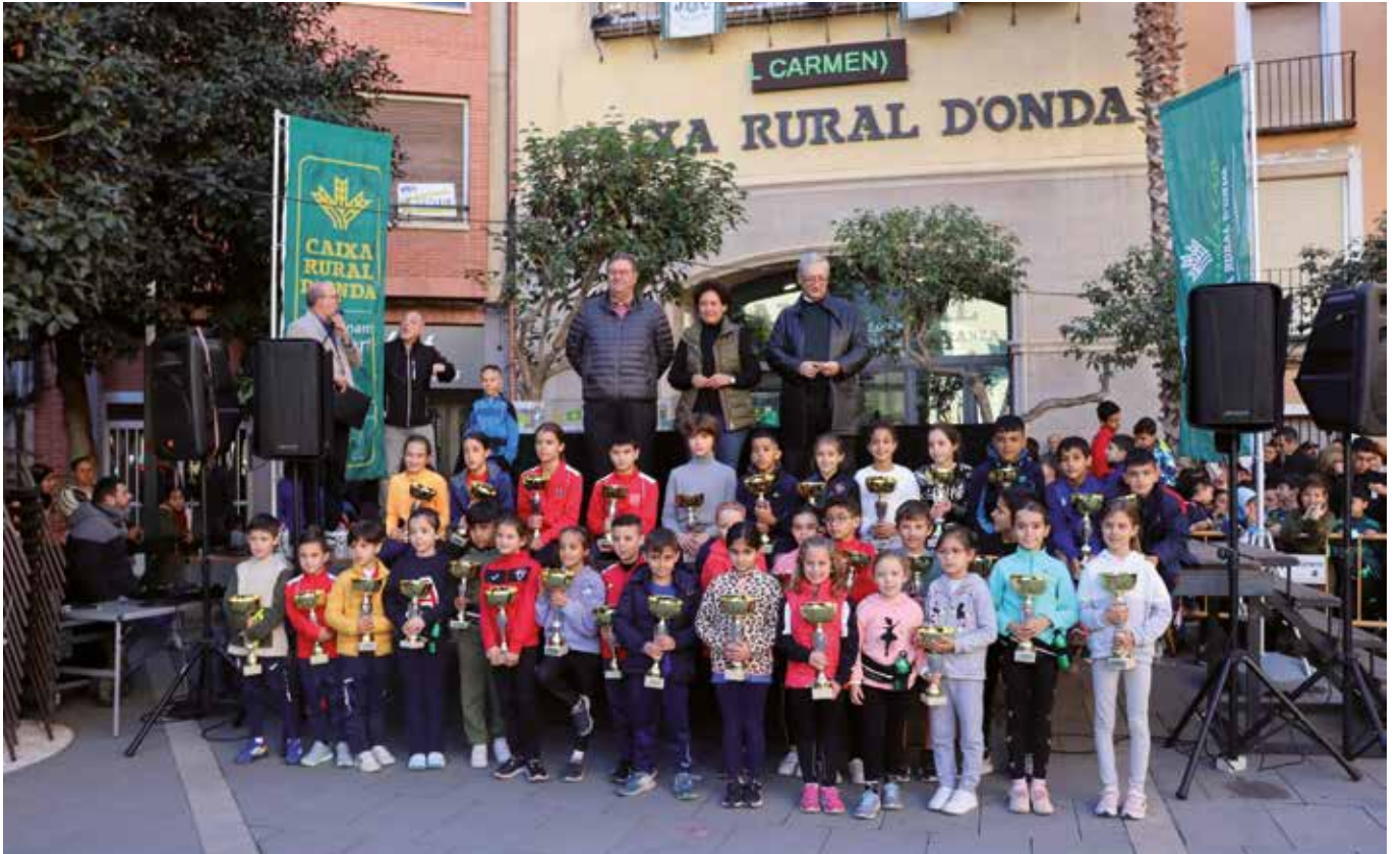
Ganadores del XLI Cros Escolar de la Caja Rural.